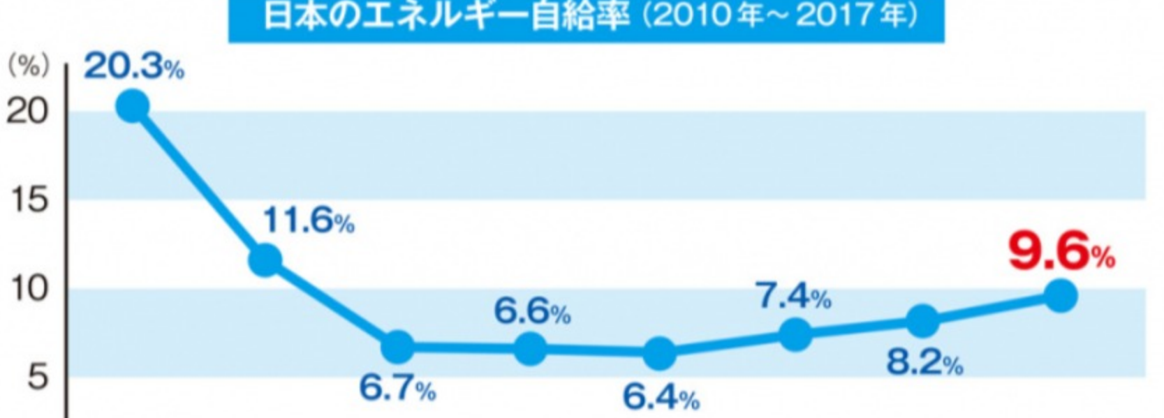
日本のエネルギー自給率（2010年～2017年）

輸入が多い農林水産業では「自給率」を素材の国産（例えば飼料にまで遡っての国産）にこだわって定義しています。エネルギーの分野ではエネルギー自給率は「国民生活や経済活動に必要な一次エネルギーのうち、自国内で生産・確保できる比率」（資源エネルギー庁）です。この定義はあいまいです。